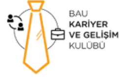
Kariyer ve Gelişim Kulübü